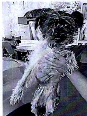
Fotografía 1. Vista de los ejemplares caninos.