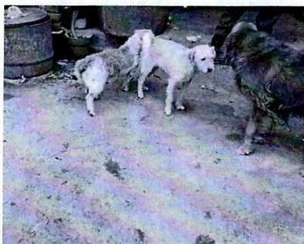
Fotografía 1. Vista de los ejemplares caninos “ Muller” “Tish” y “Roko”.