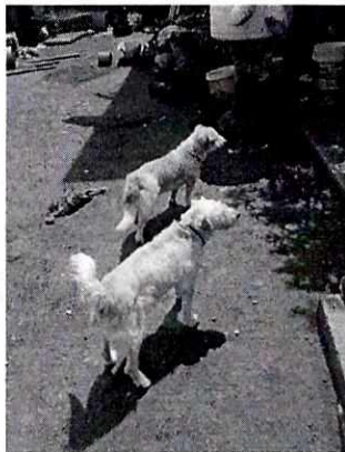
Fotografía 3. Muestra a los ejemplares caninos deambulando libremente.