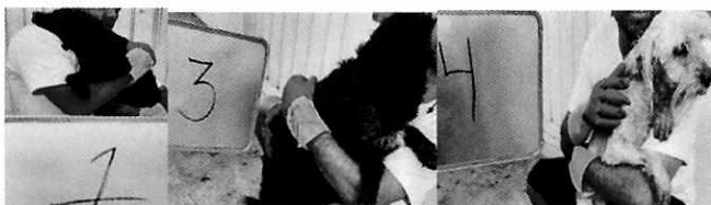
En la imagen se observa tres caninos.