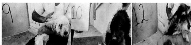
En la imagen se observa tres caninos.