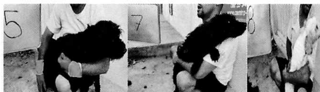
En la imagen se observa tres caninos.