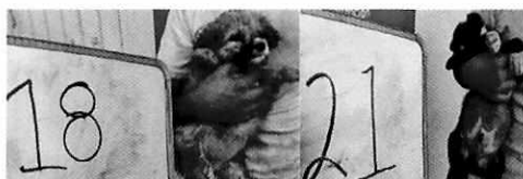
En la imagen se observa tres caninos.