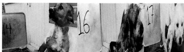
En la imagen se observa tres caninos.