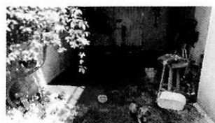
En la imagen se observa el patio donde se alojan.

En seguimiento a la presente investigación, la persona denunciante, mediante llamada telefónica indicó que en la azotea del inmueble hay materia fecal de perros en el piso y en costales. Por lo anterior, se tuvo comunicación vía telefónica con el propietario del inmueble quien refirió que tiene costales con heces de perros.