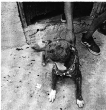
Imagen 1.- Canino objeto de investigación.