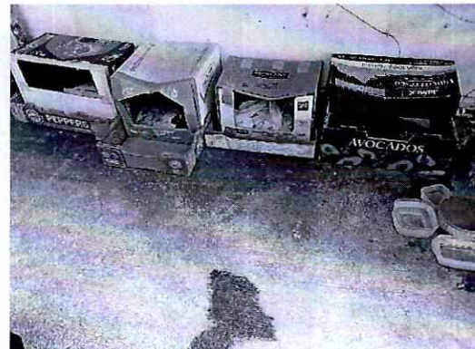
Fotografía 1 y 2. Vista del lugar de alojamiento donde habitan los ejemplares felinos.