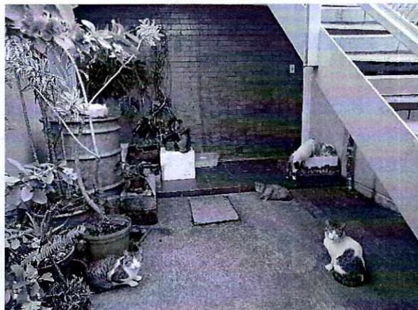
Fotografía 6 y 7. Lugar de alojamiento limpio

Derivado de lo anterior, y no quedando actuaciones pendientes por parte de esta Subprocuraduría Ambiental, de Protección y Bienestar a los Animales para el caso que nos ocupa, se procede a dar por concluida la investigación de la denuncia ciudadana bajo el número de expediente citado al rubro, con fundamento en el artículo 27 fracción III de la Ley Orgánica de la Procuraduría Ambiental y del Ordenamiento Territorial de la Ciudad de México.