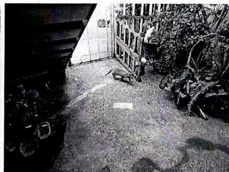
Fotografía 5. Espacio limpio

Aunado a lo anterior, y con la finalidad de contar con mayores elementos, se citó a la persona propietaria de los ejemplares felinos, quien en atención al oficio PAOT-05-300/200-4581-2019, se presentó a comparecer en las oficinas de esta Procuraduría, durante dicho acto manifestó que sus animales de compañía recibieron la atención médica veterinaria correspondiente, exhibiendo los certificados médicos que acreditan su dicho, aunado a lo anterior, mencionó que ha dado en adopción y esterilizado a diversos ejemplares felinos que llegan a su inmueble, asimismo, se comprometió a llevar a cabo la esterilización de cuatro ejemplares felinos más para evitar que la población continúe multiplicándose.