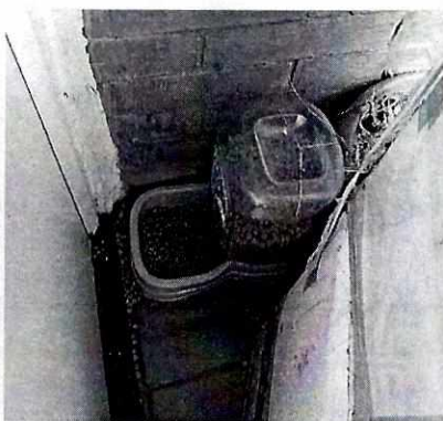
Fotografía 4. Se observa el comedero de los felinos