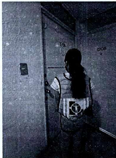
Imágenes 1 y 2. Domicilio referido por la persona denunciante.

En virtud de lo antes expuesto, esta Entidad considera procedente emitir la presente resolución, de conformidad con el artículo 27 fracción VI de la Ley Orgánica de esta Procuraduría, por imposibilidad material, en virtud de que dejaron de existir los hechos denunciados, al ya no encontrarse el ejemplar canino en el lugar de la denuncia.