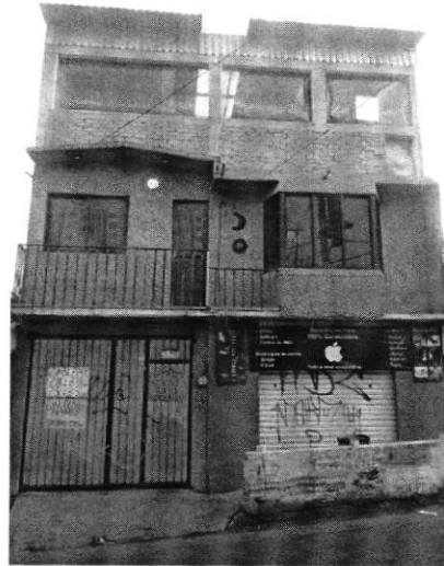
Imagen 1.- Domicilio, objeto de investigación.

En este sentido, de las constancias que obran en el presente expediente, se desprende que personal de esta Subprocuraduría llevó a cabo el reconocimiento de hechos de conformidad con el artículo 15 BIS 4 fracción IV de la Ley Orgánica de esta Entidad, diligencia en la que se identificó el domicilio referido en el escrito de denuncia; sin embargo no se constataron emisiones sonoras provenientes del interior del inmueble desde la vía pública.