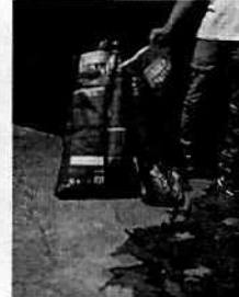
Fotografías 4-7. Se muestra el cuarto donde los caninos se resguardan de la intemperie.