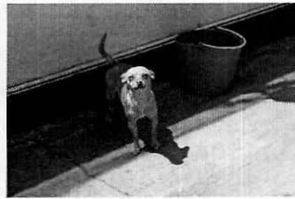
Fotografías 1-3. Vista de los ejemplares caninos.