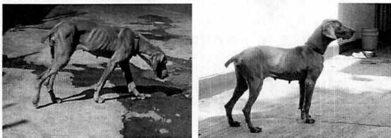
Fotografías 8-9. Se observa la comparación en donde se ve la mejoría de la condición corporal del ejemplar canino con problemas de salud.

ejemplar canino que responde al nombre de "Bella" presenta una mejoría en su condición corporal, toda vez que sus costillas son fácilmente palpables con mínimo recubrimiento de grasa, además se observa su cintura claramente, así como un pliegue abdominal evidente.