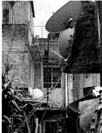
Fotografía 1. Se muestran dos ejemplares caninos localizados en el inmueble señalado en el escrito de la presente denuncia.

En este sentido, personal de esta Subprocuraduría realizó un reconocimiento de hechos de acuerdo a lo establecido en el artículo 15 BIS 4 fracción IV de la Ley Orgánica de esta Entidad, diligencia en la cual se constató la presencia de dos ejemplares caninos vistos desde el interior del conjunto habitacional, por lo que se procedió a tocar la puerta del interior número 4, a fin de informar al habitante el motivo de la presente denuncia; sin embargo, el personal actuante no fue atendido impidiendo llevar a cabo la valoración de los ejemplares caninos motivo de denuncia, por lo que se notificó el citatorio correspondiente mediante formato de instructivo, mismo que no fue atendido.