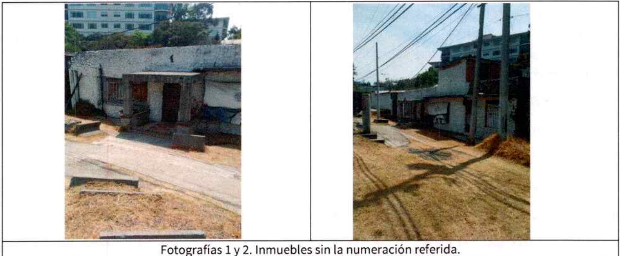
Fotografías 1 y 2. Inmuebles sin la numeración referida.

Es de resaltar que, en el Acuerdo de Admisión, que fue enviado por correo electrónico a la persona denunciante, se le hizo de conocimiento que contaba con un término de seis días hábiles para aportar las pruebas que estimara pertinentes en la investigación de los hechos, lo anterior conforme al artículo 90 del Reglamento de la Ley Orgánica de la Procuraduría Ambiental y del Ordenamiento Territorial de la Ciudad de México; sin embargo durante el procedimiento de investigación, no fueron proporcionados elementos de prueba que pudieran determinar incumplimiento a la normatividad en materia de bienestar animal.