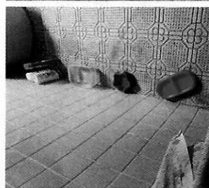
Fotografías 1-9. Ejemplares motivo de denuncia y lugar de alojamiento.