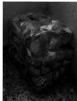
Fotografía 10-12. Bultos de alimento y arena para gato.

Es de resaltar que, en el Acuerdo de Admisión, que fue enviado por correo electrónico a la persona denunciante, se le hizo de conocimiento que contaba con un término de seis días hábiles para aportar las pruebas que estimara pertinentes en la investigación de los hechos, lo anterior conforme al artículo 90 del Reglamento de la Ley Orgánica de la Procuraduría Ambiental y del Ordenamiento Territorial de la Ciudad de México; sin embargo durante el procedimiento de investigación, no fueron proporcionados elementos de prueba que pudieran determinar incumplimiento a la normatividad en materia de bienestar animal.