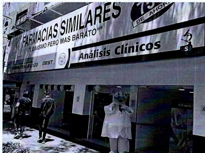
Fotografía única. Vista exterior del establecimiento denunciado.

En atención a la denuncia, se desprende que personal de esta Subprocuraduría llevó a cabo dos visitas de reconocimiento de hechos, de conformidad con el artículo 15 BIS 4 fracción IV de la Ley Orgánica de esta Entidad, diligencias durante las cuales no se constató la operación de equipos de sonido para promocionar el local comercial, por lo que no fueron percibidas emisiones sonoras; no obstante lo anterior, durante entrevista sostenida con el personal de la farmacia, se indicó al personal de esta Procuraduría que, debido a las quejas de los vecinos, ya no se implementaría el uso de bocinas promocionales.