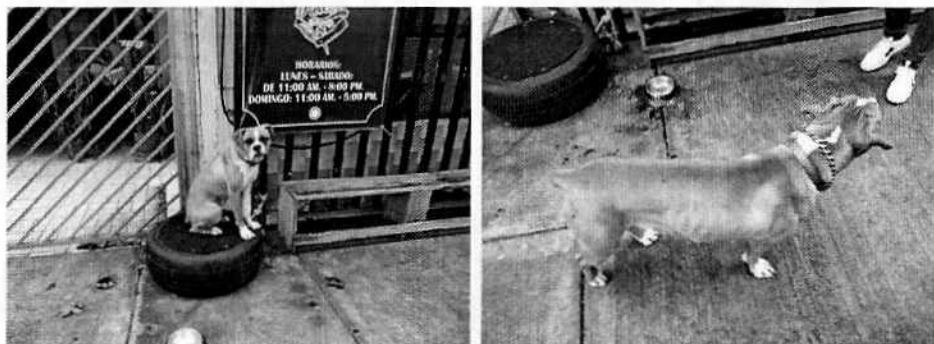
Fotografías 1-2. Vista del ejemplar canino.