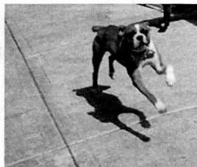
Fotografías 3-4. Se observa al ejemplar canino de manera libre, aunado a que se constató una mejoría en la condición corporal del mismo.

En seguimiento de la denuncia, personal adscrito a esta Subprocuraduría llevó a cabo una nueva visita de reconocimiento de hechos, durante la cual desde la vía pública no se constató la presencia del ejemplar canino motivo de denuncia, por lo cual se tuvo comunicación con el propietario del animal de compañía en mención, quien refirió que fue dado en adopción con un familiar a fin de proporcionarle un lugar de alojamiento adecuado.