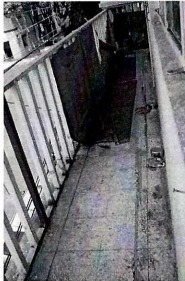
Fotografía 3. Balcón al que tiene acceso el canino.

PROCURADURÍA AMBIENTAL Y DEL ORDENAMIENTO TERRITORIAL DE LA CIUDAD DE MÉXICO SUBPROCURADURÍA AMBIENTAL, DE PROTECCIÓN Y BIENESTAR A LOS ANIMALES