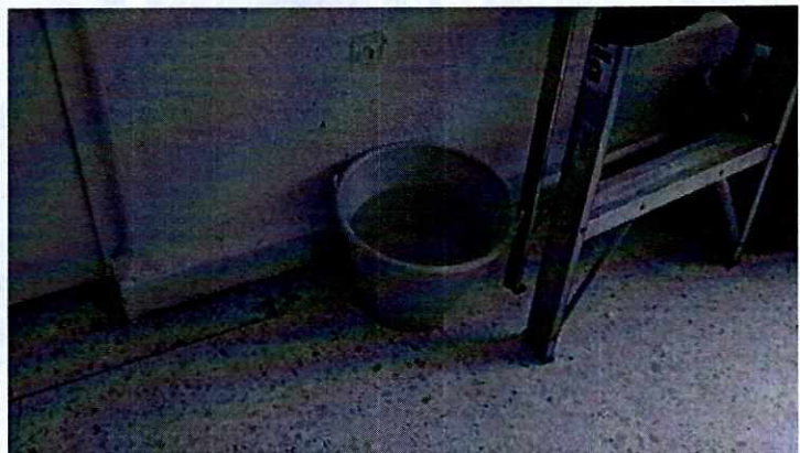
Fotografías 1 y 2. Vista del canino motivo de denuncia y del recipiente con agua a su disposición.