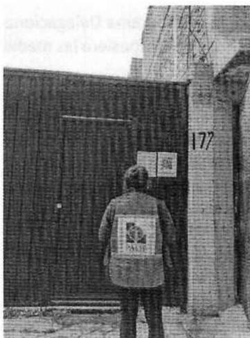
Fotografía 1. Fachada del taller objeto de denuncia

Derivado de la medición de emisiones sonoras, se desprendió que el taller en comento constituía una fuente emisora que, en las condiciones de operación presentadas durante la visita en la que se practicó la medición acústica, transmitía al punto de denuncia un nivel sonoro de 47.49 dB(A), el cual no excedía los límites máximos permisibles de emisiones sonoras de 63.0 dB(A) para el horario de las 06:00 a 20:00 horas, especificado en la Norma Ambiental NADF-005-AMBT-2013. Asimismo, durante las diligencias no se advirtieron vibraciones mecánicas o emisiones de partículas a la atmósfera, generadas por el funcionamiento del taller motivo de denuncia.