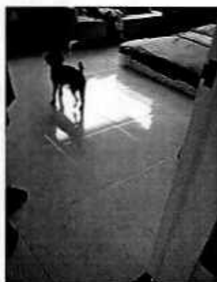
Figuras 1-5. Se observan los ejemplares caninos localizados en el inmueble motivo de denuncia, así como sus recipientes para croquetas.