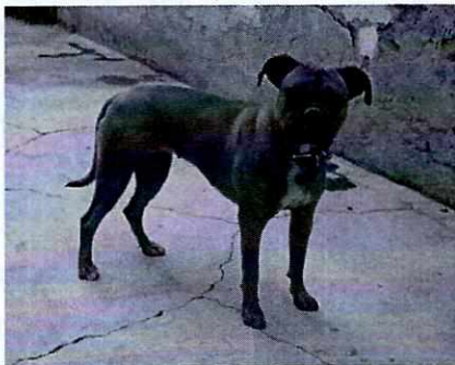
Fotografía 1. Ejemplar canino motivo de denuncia.

En seguimiento a lo anterior, se realizó nueva visita de reconocimiento de hechos, durante la cual el personal de esta Entidad tuvo acceso al inmueble en donde se encuentra el canino, constatando que el mismo presenta condición corporal ideal, toda vez que no son evidentes las protuberancias óseas, presenta pliegue abdominal y recubrimiento de grasa en las costillas, el cual exhibe una postura relajada y sostiene contacto visual sin dar señas de agresividad, al momento en que su propietario interactúa con él, se muestra dispuesto al juego. Además no fueron detectadas lesiones ni signos de dolor al aplicar presión en su cuerpo. Al momento de la visita se advirtió la presencia de recipientes con agua limpia para su libre disposición, así como una casa habilitada la cual proporciona protección contra la intemperie.