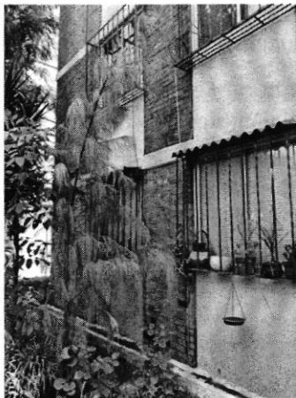
Fotografía 5. Pino, árbol con el que se compensó el daño.

Por lo anterior y no quedando actuaciones pendientes por parte de esta Procuraduría, se procede a dar por concluida la investigación de la denuncia ciudadana bajo el número de expediente citado al rubro, con fundamento en el artículo 27 fracción VII de la Ley Orgánica de la Procuraduría Ambiental y del Ordenamiento Territorial de la Ciudad de México.