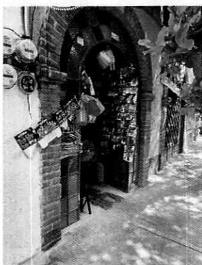
Figura 1. Vista del establecimiento motivo de denuncia.

De acuerdo a las documentales que obran en el presente expediente, el establecimiento antes referido encuadra en el supuesto de ser una fuente fija conforme a la Norma Ambiental para el Distrito Federal NADF-005-AMBT-2013, que establece las condiciones de medición y los límites máximos permisibles de emisiones sonoras de aquellas actividades o giros que para su funcionamiento utilicen maquinaria, equipo, instrumentos, herramienta, artefactos o instalaciones que generan emisiones sonoras al ambiente.