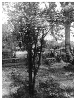
Fotografía 4. Chabacano número 1