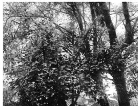
Fotografía 5. Chabacano número 2