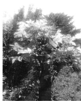
Fotografía 3. Capulín número 2