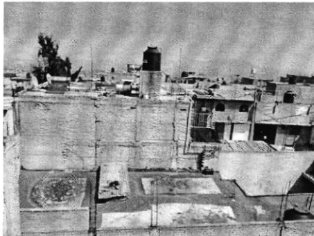
Fotografía 2. Sitio de alojamiento del canino.

En virtud de lo anterior, se realizó una segunda visita de reconocimiento de hechos, donde se constató que el ejemplar canino motivo de la presente investigación ya no se encuentra al interior del domicilio referido, toda vez que se tuvo contacto con un vecino de la zona, quien informó que las personas que se encontraban viviendo en el domicilio mencionado se fueron hace un mes y medio, y consigo se llevaron al canino, asimismo permitió ingresar a su domicilio desde donde se observó que el canino ya no se encuentra en el inmueble.