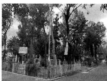
Figura 1. Se observa el individuo arbóreo motivo de denuncia, el cual ha recuperado su follaje.

En virtud de lo antes expuesto, esta Entidad considera procedente emitir la presente resolución, de conformidad con el artículo 27 fracción VI de la Ley Orgánica de esta Procuraduría, por imposibilidad legal, al no constatar irregularidades en materia de arbolado.