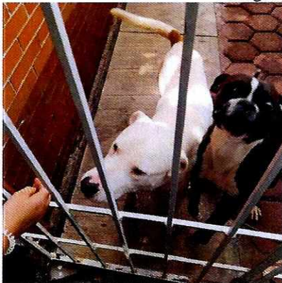
Fotografías de los ejemplares motivo de denuncia