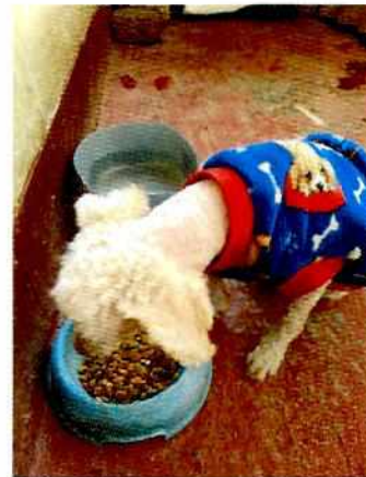
Fotografía 1-4. Evidencia de las adecuaciones.

En virtud de lo antes expuesto, esta Entidad considera procedente emitir la presente resolución, de conformidad con el artículo 27 fracción VII de la Ley Orgánica de esta Procuraduría, por el cumplimiento voluntario de las disposiciones jurídicas en materia de bienestar animal.