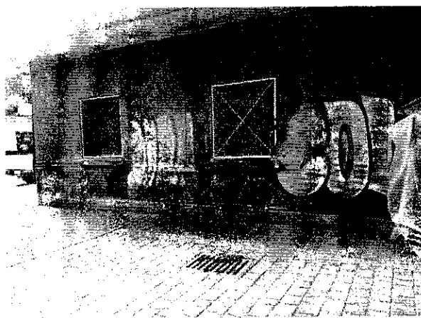
Imagen 3. Los ejemplares caninos ya no se encuentran en vía pública.