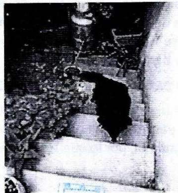
Fotografías del ejemplar motivo de la denuncia.

Medellín 202, piso 4, colonia Roma Norte Alcaldía Cuauhtémoc, C.P. 06700, Ciudad de México Tel. 5265 0780 ext 12011 y 12400