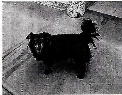
Fotografías del ejemplar motivo de la denuncia.

En virtud de lo antes expuesto, esta Entidad considera procedente emitir la presente resolución, de conformidad con el artículo 27 fracción VII, por el cumplimiento voluntario de las disposiciones jurídicas en materia de bienestar animal.