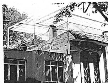
Imagen en la que se advierte la colocación de una cubierta plegable.