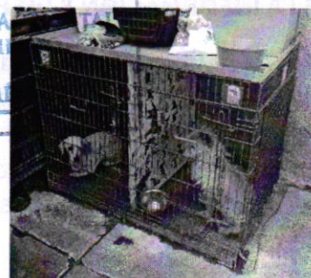
Fotografías 1 y 2. Vista de los ejemplares caninos que responden a los nombres de "Milo", "Güera" y "Pirata".

PROCURADURÍA Y DEL ORDENAM TERRITORIAL DE LA CIUDAD DE M