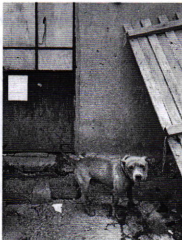
Fotografía 1. Vista del ejemplar canino motivo de denuncia.