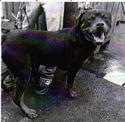
Fotografía 1. Vista del ejemplar canino que responde al nombre de "Ragnar".

potencialmente mortales, así como la atención médico veterinaria que en su caso pueda requerir; al respecto, mostró los certificados de vacunación actualizados de ambos animales de compañía. En lo que respecta a "Zeus", presentaba dermatitis, y de acuerdo a lo referido por su responsable, se encontraba recibiendo el tratamiento correspondiente.