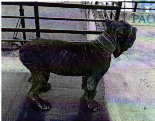
Fotografía 3. Vista del ejemplar canino que responde al nombre de "Zeus".

En seguimiento a la denuncia, personal de esta Subprocuraduría realizó un reconocimiento de hechos, en el cual constató que el canino "Zeus" aumentó su masa muscular; sin embargo, aún se observó delgado, aunado a lo anterior, presentaba zonas alopecicas evidentes en las extremidades y en la cola, así como puntos de sutura, resultado de una cirugía reciente en el área superior de los párpados. Al respecto, recibió la atención médico veterinaria correspondiente, de la cual se desprende que el especialista encargado de su revisión, recomendó la aplicación de un tratamiento a base de medicamentos para controlar la dermatitis infecciosa causada por hongos y levaduras, adicionados con un complemento multivitamínico.