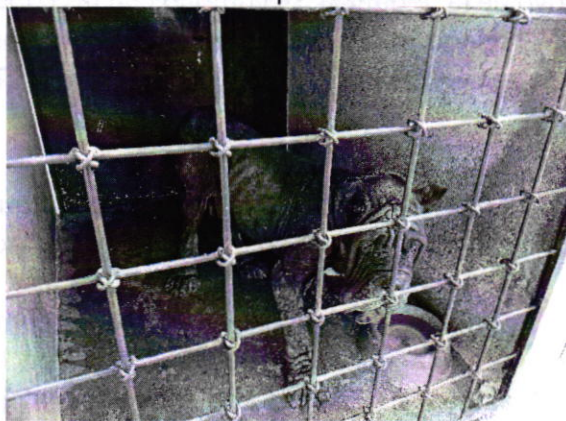
Fotografía 2. Vista del ejemplar canino que responde al nombre de "Zeus".

En seguimiento a la denuncia, personal de esta Subprocuraduría realizó un reconocimiento de hechos, en el cual constató que el canino "Zeus" aumentó su masa muscular; sin embargo, aún se observó delgado, aunado a lo anterior, presentaba zonas alopecicas evidentes en las extremidades y en la cola, así como puntos de sutura, resultado de una cirugía reciente en el área superior de los párpados. Al respecto, recibió la atención médico veterinaria correspondiente, de la cual se desprende que el especialista encargado de su revisión, recomendó la aplicación de un tratamiento a base de medicamentos para controlar la dermatitis infecciosa causada por hongos y levaduras, adicionados con un complemento multivitamínico.