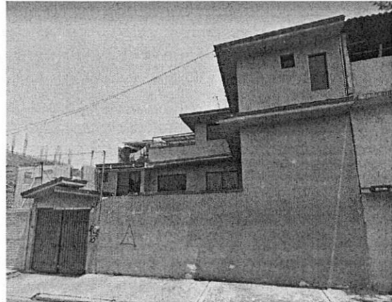
Imagen google maps, abril 2019.