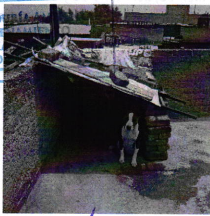
Fotografía 2. Vista del ejemplar canino que responde al nombre de "Calesi".