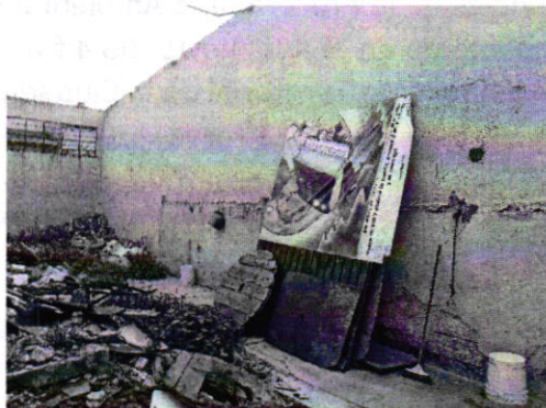
Fotografía 3. Vista del sitio en el cual se localizaban los ejemplares caninos motivo de denuncia.

En seguimiento a la denuncia, se realizó otro reconocimiento de hechos por personal adscrito a esta Subprocuraduría, en el cual se constató que derivado del cumplimiento voluntario por parte de la persona propietaria de los ejemplares caninos motivo de denuncia, fueron retirados del sitio antes referido y reubicados al domicilio de un familiar en el Estado de México.