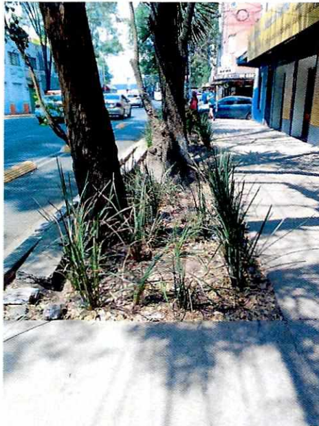
Figura 2. Árbol motivo de denuncia.

En seguimiento, se realizó otra visita de reconocimiento de hechos donde se constató que la jardinera donde se encuentra el árbol motivo de denuncia cuenta con plantas de ornato y el local ambulante semi-fijo ya no se encuentra en el sitio referido, sino media cuadra adelante.