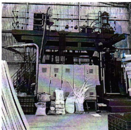
Fotografía 2. Vista de equipo utilizado para la fabricación de tablonés.