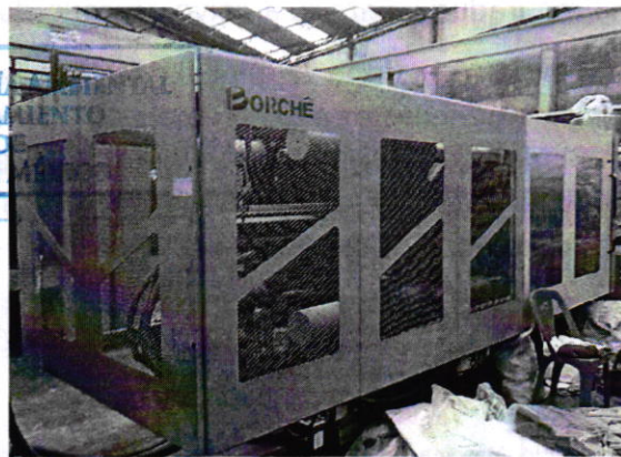
Fotografía 3. Vista de equipo utilizado para la fabricación de sillas.

De lo anterior se concluye que personal de esta Entidad realizó dos visitas de reconocimiento de hechos, durante las cuales constató la generación de emisiones sonoras por el funcionamiento de maquinaria; sin embargo, del estudio de emisiones sonoras correspondiente, se desprende que no excede los límites máximos permisibles en el punto de denuncia y no quedando alguna actuación