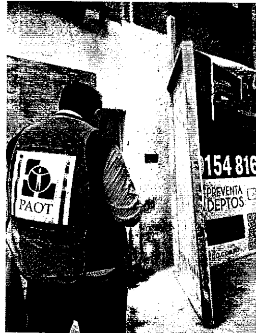
Imágenes. 1 y 2. Fachada del domicilio motivo de denuncia.

En seguimiento a la denuncia, personal de esta Entidad realizó llamada telefónica a la persona denunciante, quien afirmó que el domicilio fue demolido y desconoce el paradero de los animales o de las personas responsables de los mismos.