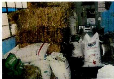
Fotografías proporcionadas en acto de comparecencia.

Finalmente, en un segundo reconocimiento de hechos, personal adscrito a esta entidad constató que actualmente en el domicilio relacionado con los hechos denunciados, solo se cuenta con dos becerros, los cuales presentan adecuada condición corporal, acorde a su etapa fisiológica y especie, ya que ha dicho de la persona que atendió la diligencia, los animales restantes se reubicaron fuera de la Ciudad de México.