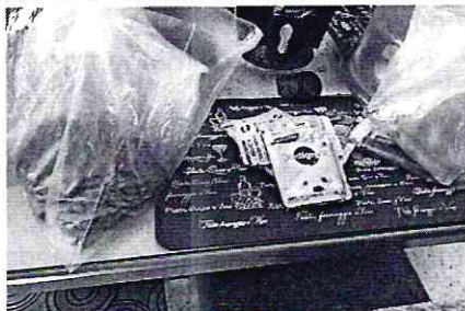
Imagen 3.- Comida con la que se alimenta al ejemplar canino.