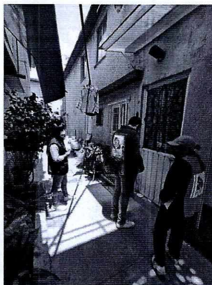
Imagen 1 y 2. Domicilio referido en el escrito de denuncia.