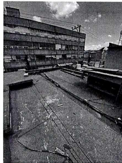
Imágenes 3 y 4. Azotea del sitio de denuncia, sin presencia del ejemplar.

Es de resaltar que, en el Acuerdo de Admisión, que fue enviado por correo electrónico a la persona denunciante, se le hizo de conocimiento que contaba con un término de seis días hábiles para aportar las pruebas que estimaran pertinentes en la investigación de los hechos, lo anterior conforme al artículo 90 del Reglamento de la Ley Orgánica de la Procuraduría Ambiental y del Ordenamiento Territorial de la Ciudad de México; sin embargo durante el procedimiento de investigación, no fueron proporcionados elementos de prueba que pudieran determinar incumplimiento a la normatividad en materia de bienestar animal.