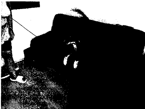
Imagen 2. Ejemplar canino de nombre "Yin".

Es de resaltar que, en el Acuerdo de Admisión, que fue enviado por correo electrónico a la persona denunciante, se le hizo de conocimiento que contaba con un término de seis días hábiles para aportar las pruebas que estimara pertinentes en la investigación de los hechos, lo anterior conforme al artículo 90 del Reglamento de la Ley Orgánica de la Procuraduría Ambiental y del Ordenamiento Territorial de la Ciudad de México; sin embargo durante el procedimiento de investigación, no fueron proporcionados elementos de prueba que pudieran determinar incumplimiento a la normatividad en materia de bienestar animal.