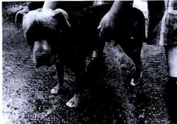
Ejemplar canino denunciado.

En este sentido, mediante oficio PAOT-05-300/200-9927-2019 del 18 de septiembre de 2019, esta entidad informó a la persona responsable del animal de compañía objeto de investigación la normatividad en materia de protección a los animales, invitándolo al cumplimiento voluntario de las disposiciones jurídicas señaladas en el mismo.