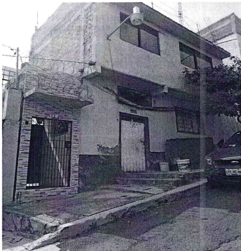
Fotografía 1. se muestra el sitio referido en el escrito de denuncia, localizado en Santa Cecilia 123, colonia Olivar del Conde, alcaldía Álvaro Obregón

En este sentido, personal de esta Subprocuraduría realizó dos visitas de reconocimiento de hechos de acuerdo a lo establecido en el artículo 15 BIS 4 fracción IV de la Ley Orgánica de esta Entidad, diligencias en las cuales el personal adscrito se constituyó en el domicilio referido en el escrito de denuncia, sin embargo no se logró observar algún ejemplar canino, ni se percibieron ladridos o indicios que denotaran que en el inmueble existen animales de compañía.