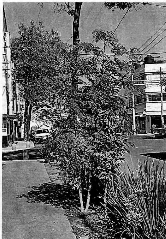
Fotografías 2 y 3. Vista del ejemplar arbóreo plantado para recuperar la cobertura vegetal dañada e imagen en donde se observa la recuperación del individuo vegetal tronchado.

Por lo anterior, considerando que esta Procuraduría gestionó la recuperación de la cobertura vegetal y no quedando actuaciones pendientes por parte de esta Subprocuraduría Ambiental, de Protección y Bienestar a los Animales para el caso que nos ocupa, se procede a dar por concluida la investigación de la denuncia ciudadana bajo el número de expediente citado al rubro, con fundamento en el artículo 27 fracción VII de la Ley Orgánica de la Procuraduría Ambiental y del Ordenamiento Territorial de la Ciudad de México.