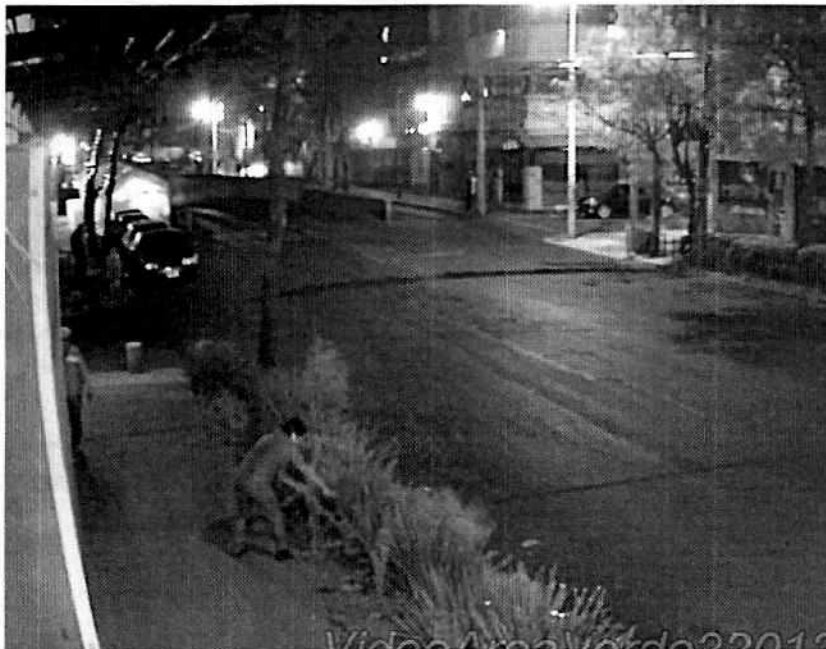
Fotografía 1. Extracto del video en donde se ve el momento en que se troncha al sujeto vegetal.

Al respecto, se encuentra lo establecido en el artículo 119 de la Ley Ambiental de Protección a la Tierra en el Distrito Federal, que prevé que las personas que realicen el derribo de árboles deberán llevar a cabo la restitución correspondiente, mediante la compensación física o económica, a efecto de conservar la cubierta vegetal necesaria para un equilibrio ecológico en la Ciudad de México. Asimismo, dicho ordenamiento establece que será equiparable al derribo de árboles cualquier acto que provoque su muerte.