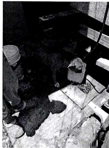
Imagen 2. Recipiente con agua.

En virtud de lo antes expuesto, esta Entidad considera procedente emitir la presente resolución, de conformidad con el artículo 27 fracción VI de la Ley Orgánica de esta Procuraduría, por imposibilidad legal, al no constatar irregularidades en materia de bienestar animal.