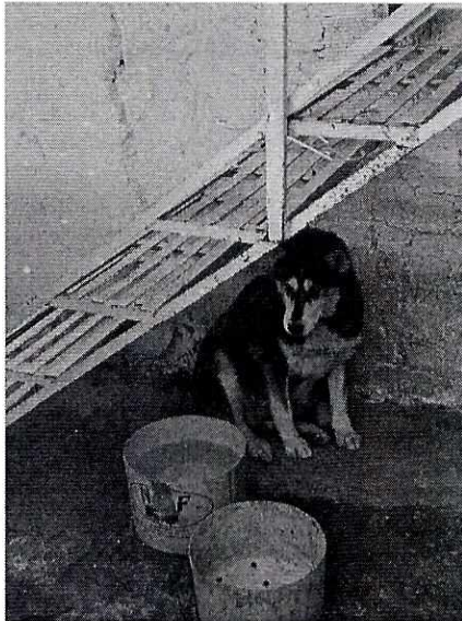
Imagen 1. Ejemplar canino motivo de denuncia.