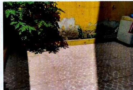
FOTOGRAFÍAS.- Vista del lugar donde se alojaba el ejemplar canino.

Con base en lo antes citado, esta Entidad, se encuentra imposibilitada legal y materialmente para continuar con la investigación, por lo que se está en aptitud de emitir la resolución administrativa que conforme a derecho procede, esto de acuerdo con la fracción VI del artículo 27 de la Ley Orgánica de la Procuraduría Ambiental y del Ordenamiento Territorial de la Ciudad de México, que a la letra establece: