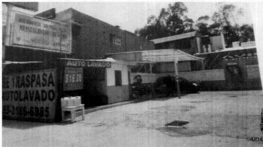
Lugar donde era alojado el canino.

No obstante, mediante oficio se hizo del conocimiento de la persona que fuera responsable del ejemplar canino objeto de investigación, las responsabilidades que se tienen que cumplir al tener animales de compañía, conminándolo a su debido cumplimiento.