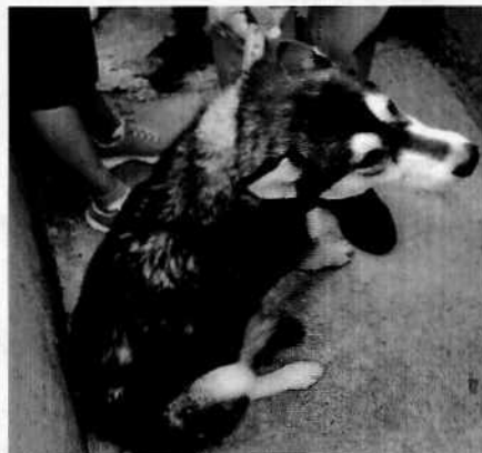
Se muestra al ejemplar canino motivo de denuncia.