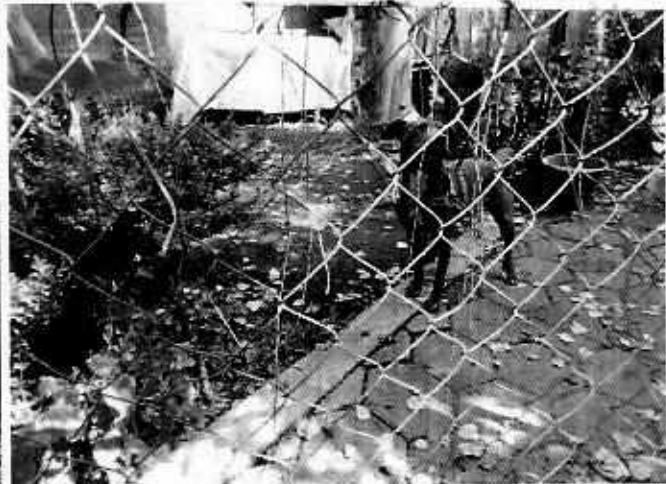
Ejemplar canino motivo de denuncia

En este sentido, personal de esta Subprocuraduría dejó pegado en puerta del edificio Q, departamento 4, oficio para que el presunto responsable del ejemplar canino objeto de investigación, compareciera ante esta Procuraduría; presentándose quien manifestó ser la persona responsable del ejemplar canino refiriendo que el inmueble al que corresponde la denuncia es el número 3 del edificio Q y que únicamente deja al ejemplar en el área verde el tiempo en que va a trabajar, ya que en las noches y si hay alguien en la casa, el canino se encuentra al interior del inmueble.