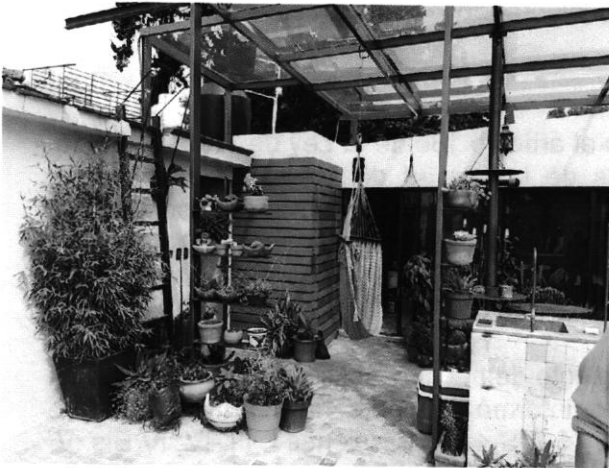
Imagen No. 1 – Al fondo de la imagen se observa el cuarto de reciente construcción y la techumbre en la azotea del inmueble.